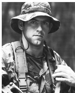
U.S. NAVY SEAL 1979-2013